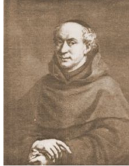
JEAN TRUCHET (1657–1729), CONTRIBUTIONS EN GRAPHISME, MATHÉMATIQUES, PHYSIQUE